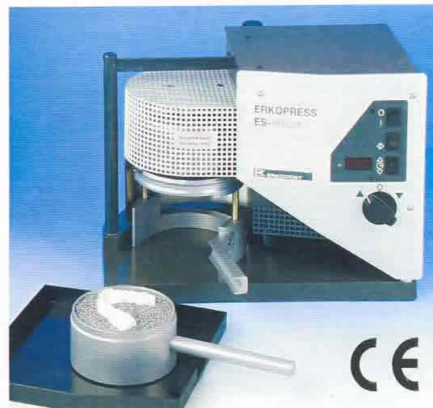
Termoformatrice a pressione con controllo a programmi per la tecnica di termoformatura dentale