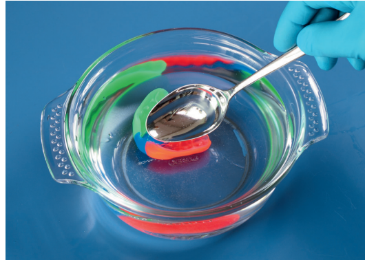
3. Tauchen Sie den Playsafe kurz (max. 2 Sek.) in kaltes Wasser.