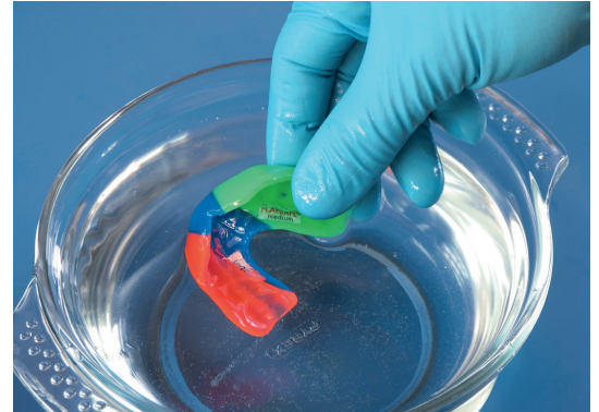
4. Nun ist die Oberfläche kalt genug, um den Sportmundschutz anzufassen und ...