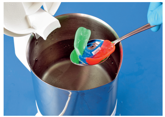
2. Nehmen Sie ihn mit Hilfe eines Löffels oder Ähnlichem heraus.