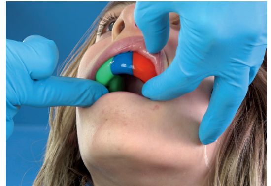
6. Drücken Sie den Sportmundschutz vorsichtig und mit wenig Kraft nach oben.