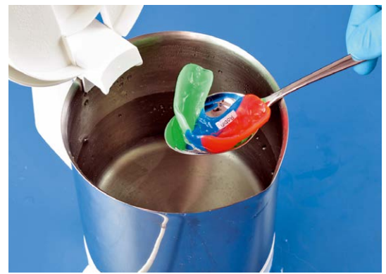
2. Togliere con l'aiuto d'un cucchiaio o altro.