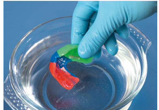
4. Ora la superficie è abbastanza fredda, per poter toccare il paradenti e ...