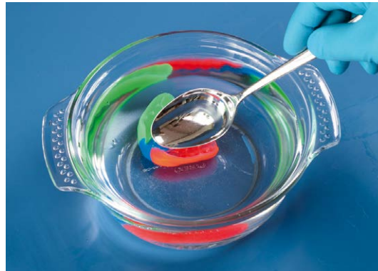
3. Immergere brevemente il Playsafe (massimo 2 secondi) in acqua fredda.