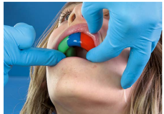
6. Posizionare il paradenti sportivo con attenzione esercitando poca pressione.