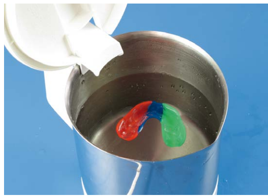
1. Mettere il paradenti sportivo in acqua bollente per 10-15 secondi.

Ad ogni riadattamento, il paradenti sportivo diventa un po' più sottile, quindi si consiglia di non riadattare il paradenti più di cinque volte.